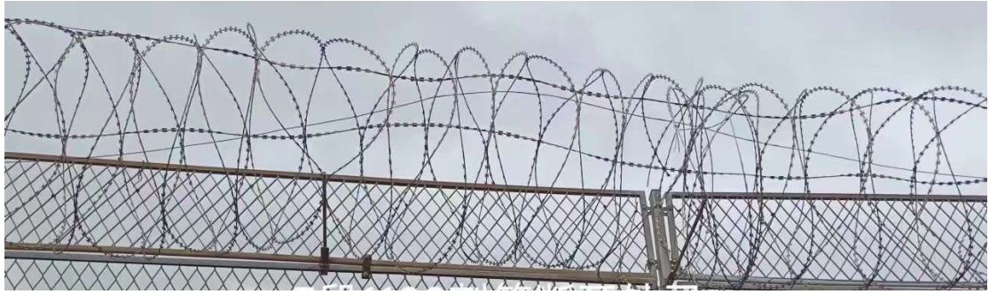
围界刺笼安装成品图